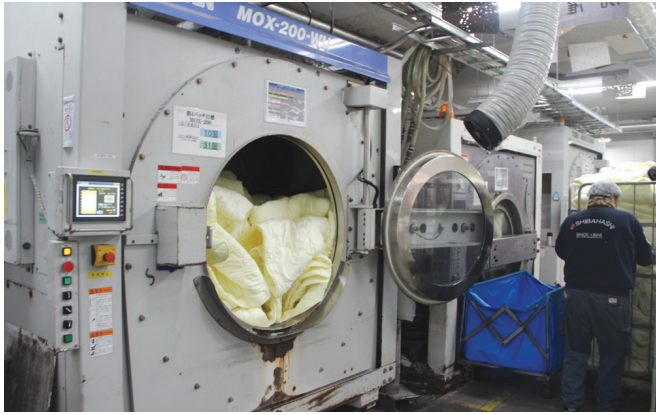
▲通常のふとん生産の合間に、保管する夏ふとんの処理を行う