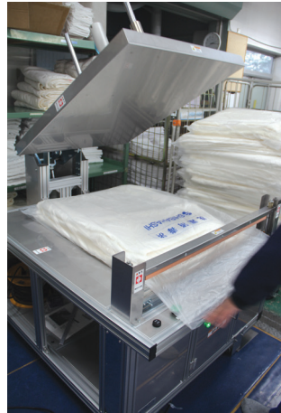
▲スタートボタンを押すとプレス板が下降して脱気を行う