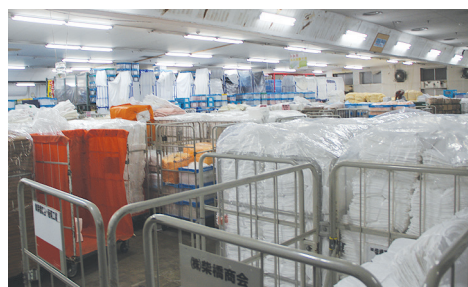
▲左は第四工場(ふとん類)、右は倉庫棟