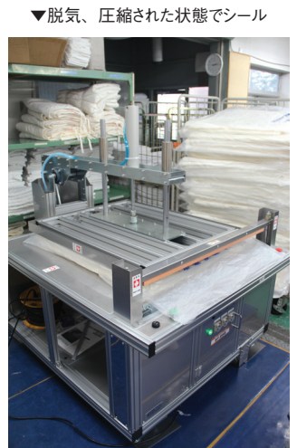
▼脱気、圧縮された状態でシール

する間は衛生上、包装する必要がある、その包装作業の効率化が課題になっていた」と語る。