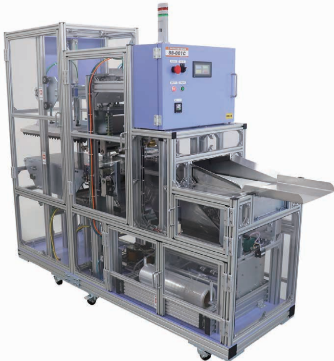
▲三方片開き全自動平面包装機「SS-001C」

新型コロナウイルスの感染拡大により、リネンサプライの客先である病院やホテル旅館はもちろん、飲食店や食品工場、温浴施設といったユニフ