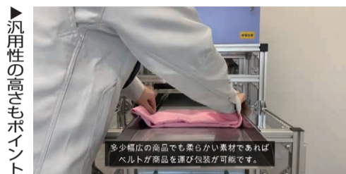
汎用性の高さもポイント

包装機器メーカーの(株)日本シーリング(埼玉県さいたま市、TEL:048-758-4422)では、タオルなどのリネン製品を自動で脱気、包装する三方片開き全自動平面包装機「SS-001C」の販売を