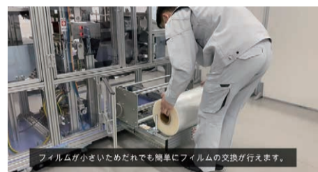
フィルムが小さいためでも簡単にフィルムの交換が行えます。

ースに、タオル、ユニフォーム、シート、ブランケットなど様々なリネン品に対応し、自動化で効率の良い生産を可能にするオリジナル仕様として開発されたのが「SS-001C」。